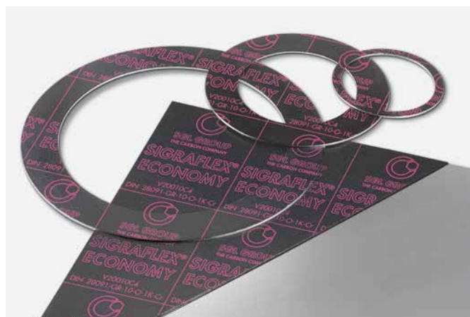
↑ SIGRAFLEX ECONOMY Těsnicí desky a těsnění