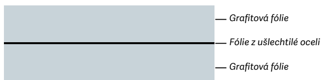
† Uspořádání vrstev