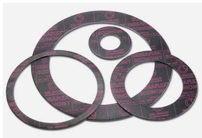
↑ Těsnění z SIGRAFLEX ECONOMY